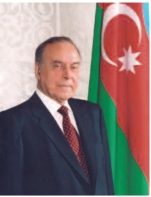
Doğma, canım-varlığım qədar sevdiyim Azərbaycanın mənim qibləgahımdır